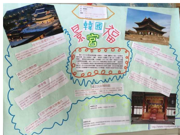
韓國景福宮，作者:馮元昕